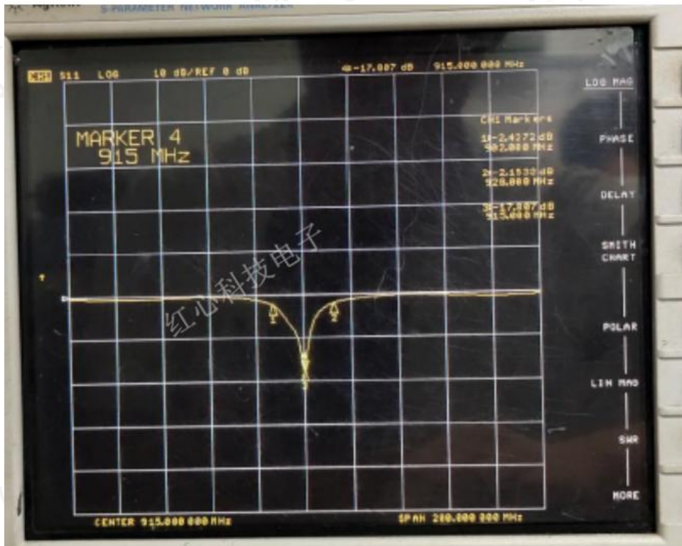
Smith Chart (史密斯圆图)